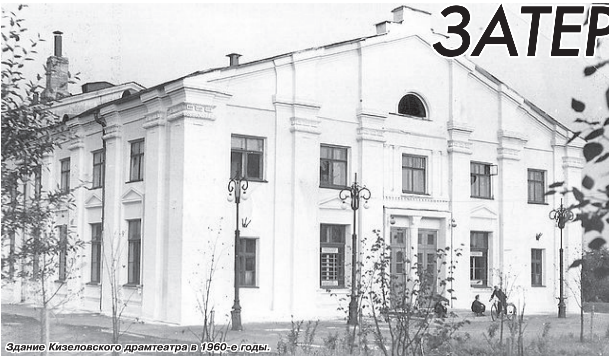
Здание Кизеловского драмтеатра в 1960-е годы.

Официально днём рождения нашего театра считается 3 августа 1982 года – по дате выхода распоряжения Пермского облисполкома №658-р «О передислокации труппы Кизеловского драматического театра на постоянную работу в город Чайковский и создании Чайковского государственного драматического театра». По этой точке отсчёта чайковская Мельпомена уже отпраздновала своё десяти-, двадцати- и тридцатилетие. Через год собирается отметить и тридцатипятилетие. При этом в очередной раз явно «омолаживается»! Ведь «передислокация» учреждения искусства даже со сменой прописки и вывески не является правовым актом его закрытия.